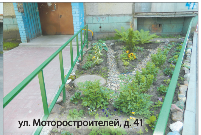
ул. Моторостроителей, д. 41