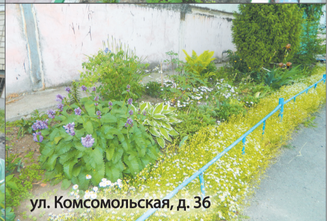
ул. Комсомольская, д. 36

Многие тутаевцы высадили у своих домов разнообразные цветы и даже создали оригинальные композиции. Палисадники радуют глаз яркими красками и ухоженностью. Мы сфотографировали лишь несколько придомовых клумб, на самом деле их гораздо больше. Хотелось бы, чтобы такая красота была у каждого подъезда в нашем городе!