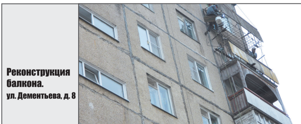
Реконструкция балкона. ул. Дементьева, д. 8