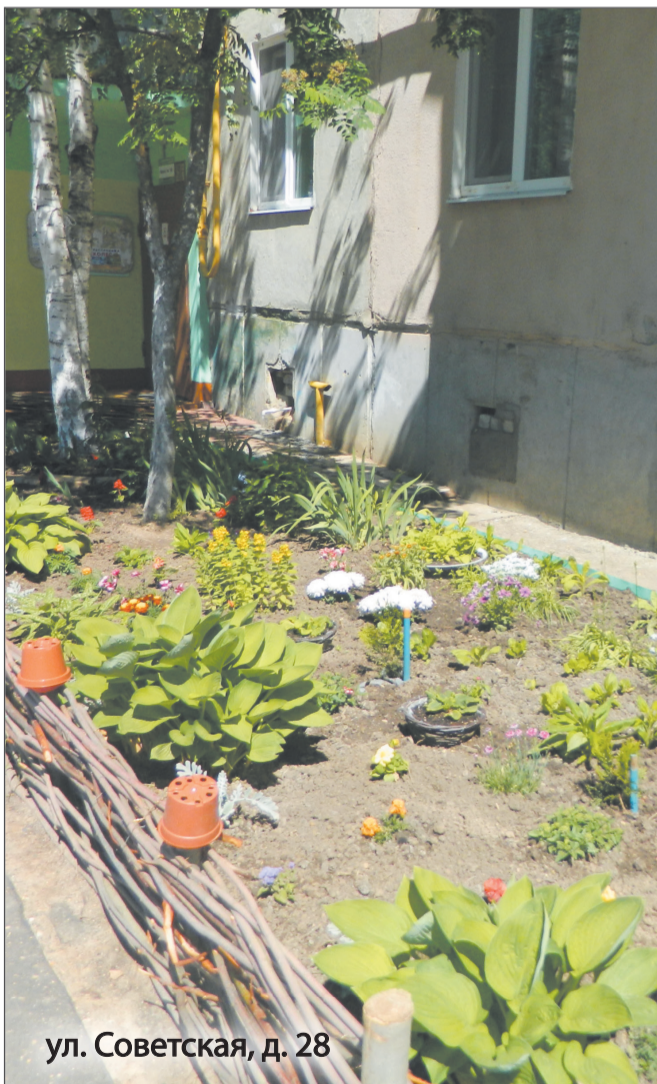
ул. Советская, д. 28