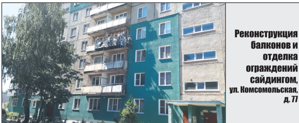
Реконструкция балконов и отделка ограждений сайдингом, ул. Комсомольская, д. 77