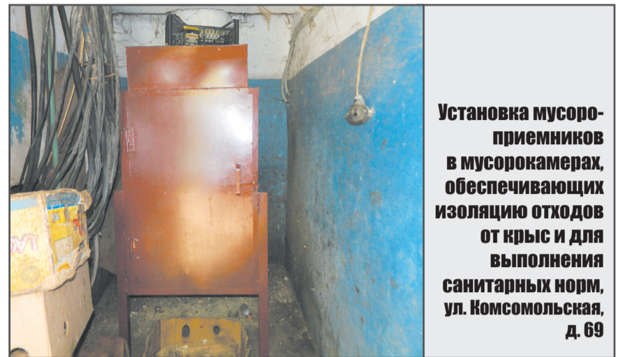
Установка мусороприемников в мусорокамерах, обеспечивающих изоляцию отходов от крыс и для выполнения санитарных норм, ул. Комсомольская, д. 69

На 2019 год управляющими компаниями «Жилфонд» и «Эталон» совместно с советами многоквартирных домов составлены и утверждены планы работ. В них отражены основные виды работ, которые необходимо выполнить в текущем периоде в соответствии с первоочередной потребностью собственников и собираемыми средствами. К концу первого полугодия уже есть дома, где планируемые мероприятия выполнены в полном объеме. Работы продолжаются. К концу года все обязательства перед жителями должны быть исполнены.