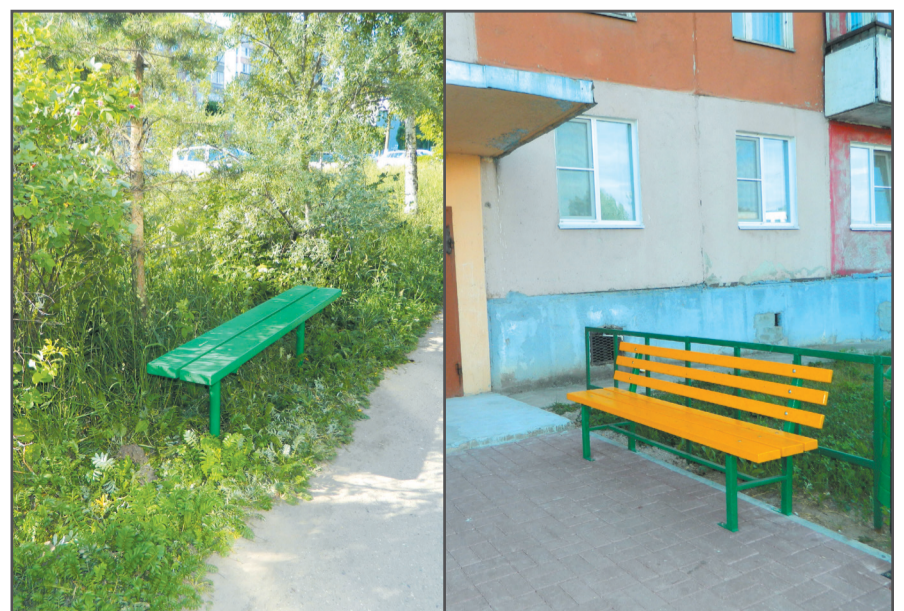
Установка лавочек, ул. Комсомольская, д. 89, ул. Советская, д. 18