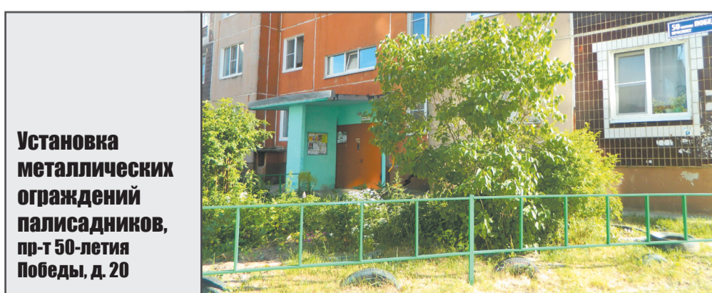
Установка металлических ограждений палисадников, пр-т 50-летия Победы, д. 20