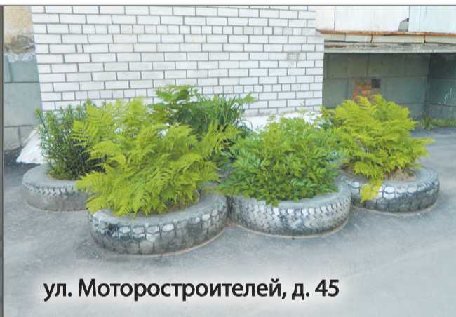
ул. Моторостроителей, д. 45