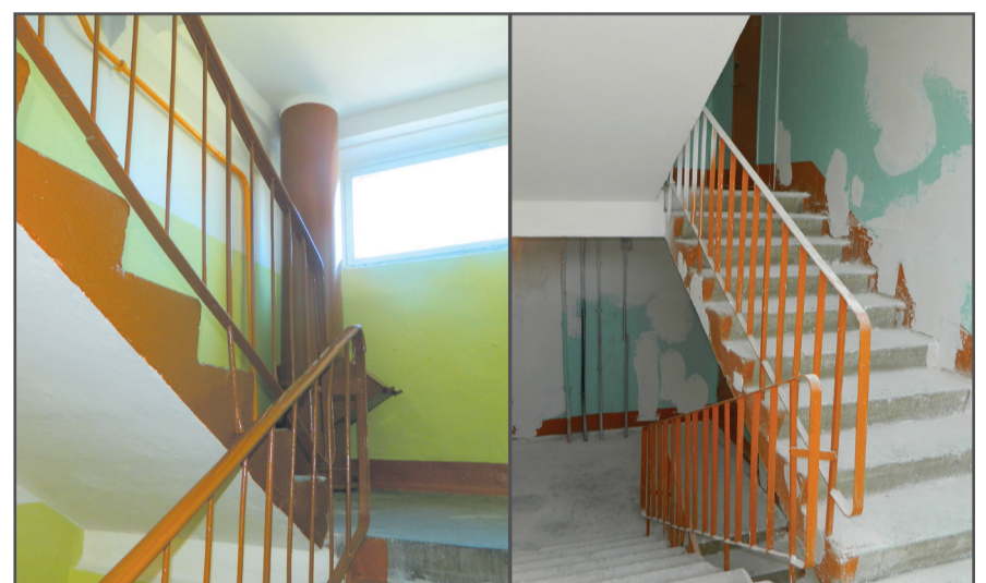
Косметический ремонт подъезда (результат и в процессе), ул. Дементьева, д. 21, ул. Моторостроителей, д. 72