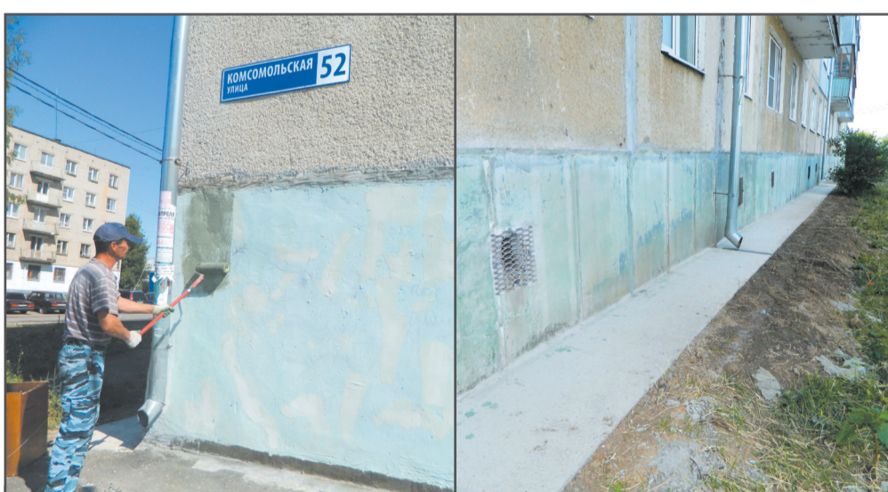
Частичное восстановление отмостки, антивандальная покраска цоколя «под шагрень», ул. Комсомольская, д. 52