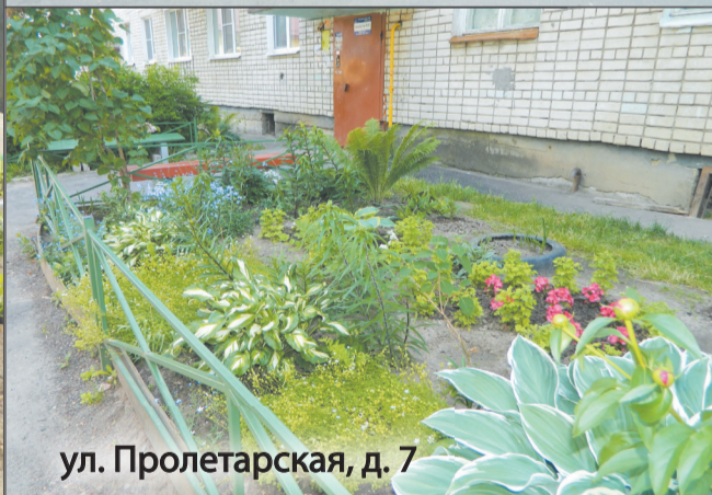
ул. Пролетарская, д. 7