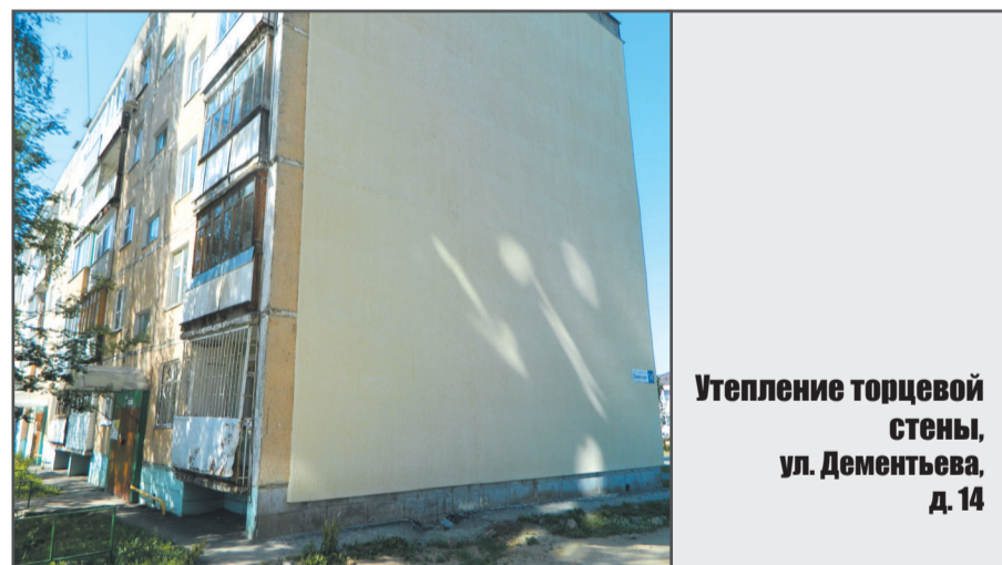
Утепление торцевой стены, ул. Дементьева, д. 14