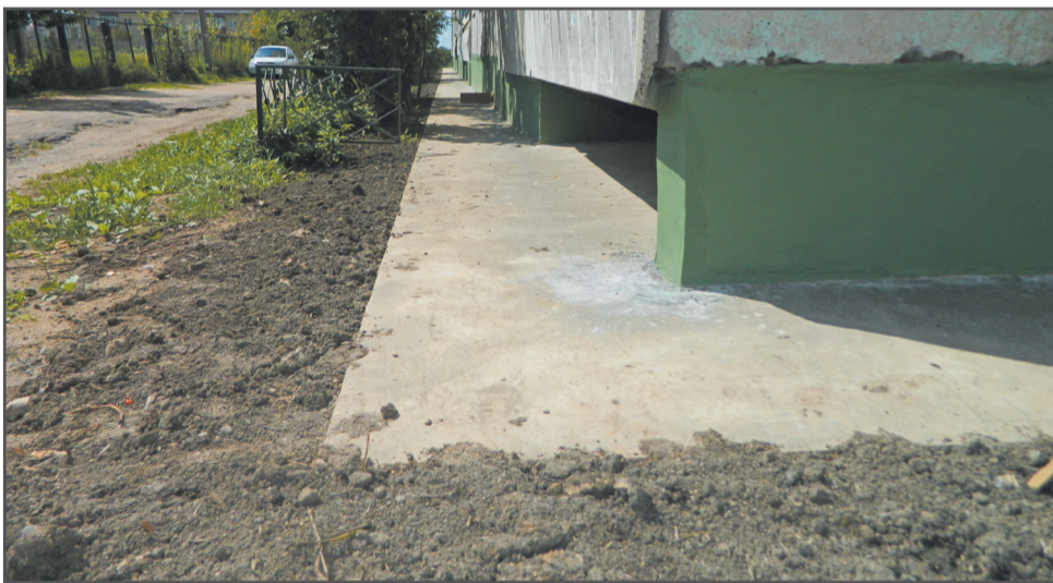
Ул. Комсомольская, д. 115. Строительство бетонной отмостки для защиты фундамента дома от влаги, промерзания и разрушения.

Продолжаем знакомить наших читателей с ежедневной деятельностью управляющих компаний по выполнению работ, запланированных в текущем месяце, и по заявлениям жителей.