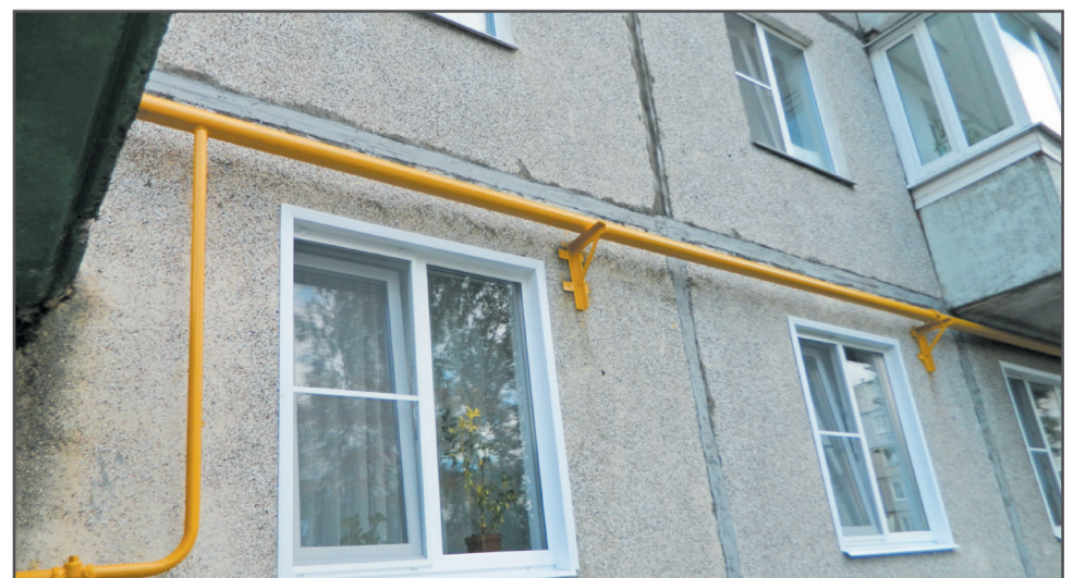
Ул. Комсомольская, д. 107, 115. Покраска газовых труб в целях защиты от коррозионных образований.