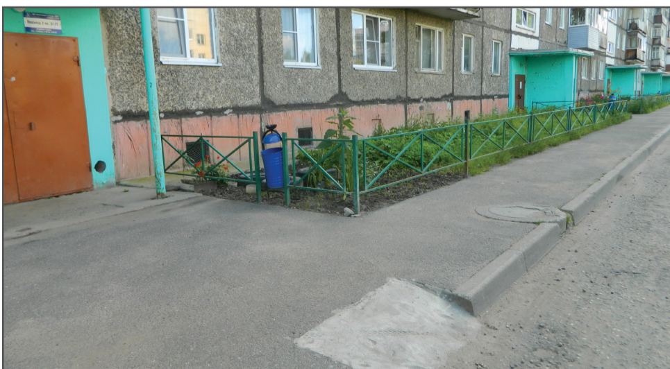
Ул. Мотростроителей, д. 79. По заявлению жителей, испытывающих ограничения движения по состоянию здоровья, выполнен пологий спуск с тротуара на проезжую часть.