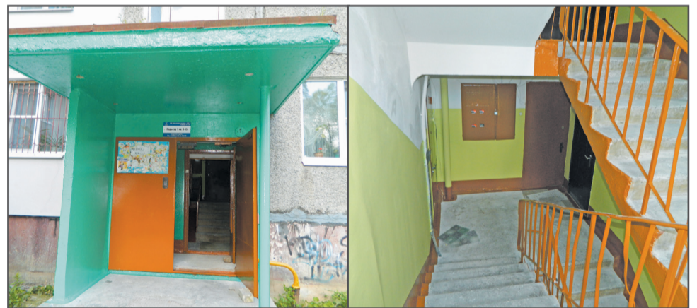
Ул. Советская, д. 33. Косметический ремонт подьезда и покраска входной группы.