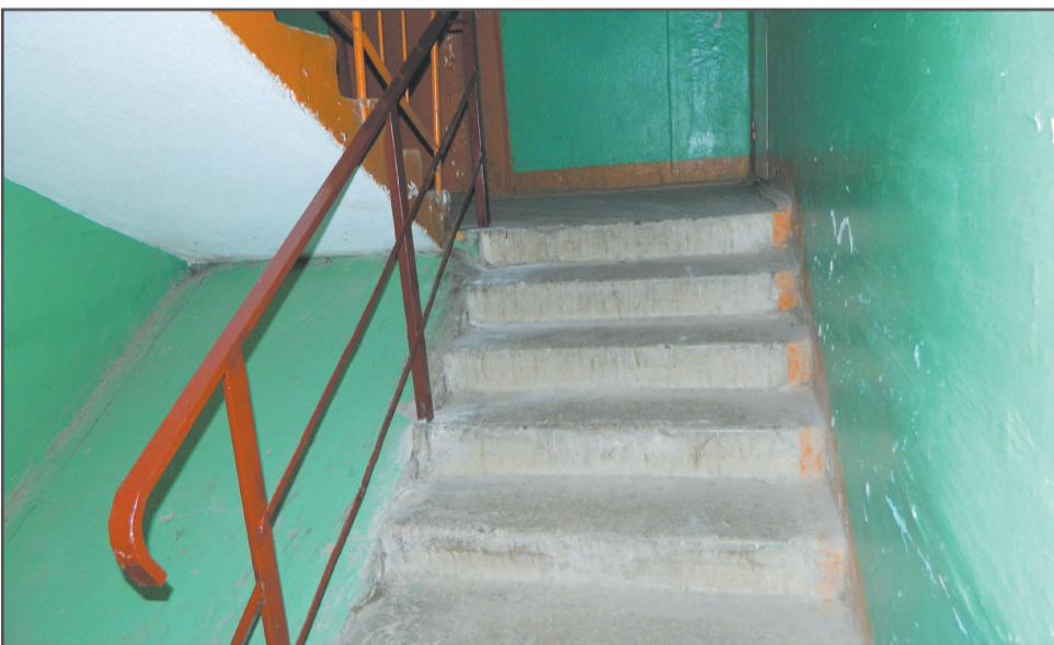
Установлены поручни на лестничном марше в подъезде № 3 дома № 125 на Комсомольской улице.