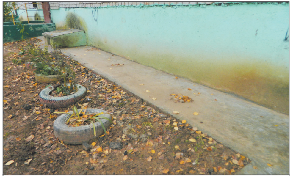
Выполнен ремонт отмостки дома № 74 на Комсомольской улице.