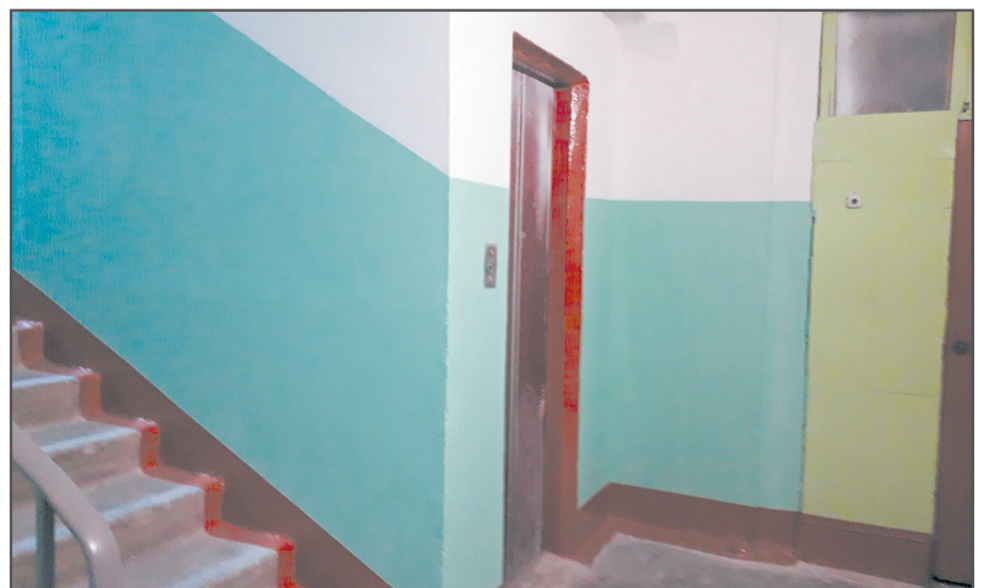
Завершен косметический ремонт подъезда дома № 51 на улице Моторостроителей.