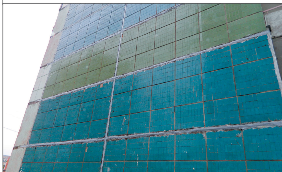
Ремонт межпанельных швов на торцевой стене в доме № 115 на Комсомольской улице.