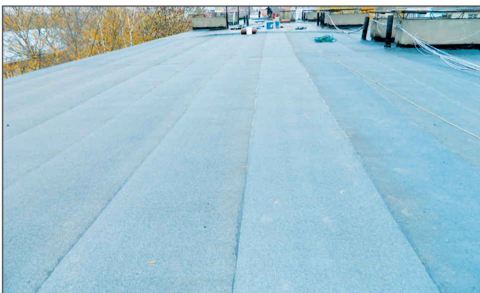
Завершается капитальный ремонт кровли с частичной заменой желобов в доме № 46 на Комсомольской улице.

Руководствуясь пословицей «Больше дела – меньше слов», представляем вам сегодня ежедневную деятельность управляющих компаний «Жилфонд» и «Эталон», которая проводится в целях содержания многоквартирных домов в надлежащем состоянии в соответствии с утвержденными с советами домов планами работ и по заявлениям собственников жилья. По отдельным видам работ указаны конкретные адреса, но на самом деле их гораздо больше. Подходят к завершению сезонные работы, такие как утепление наружных стен и ремонт межпанельных швов, но в целом деятельность не останавливается. Впереди выполнение запланированных объемов на 2020 год.