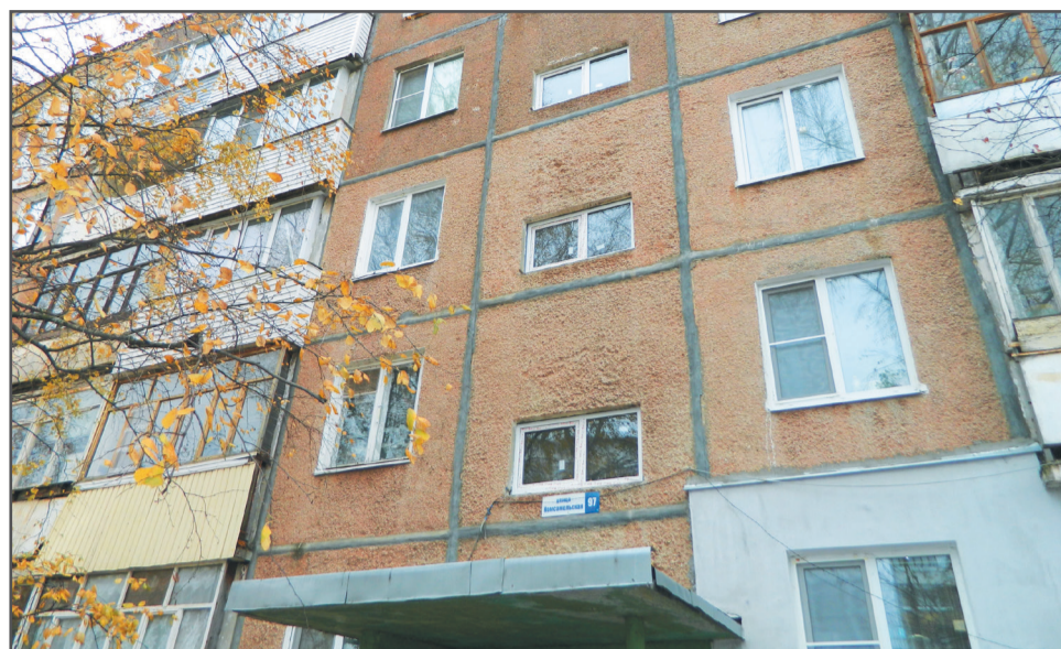
Установлены пластиковые окна в подъездах №№ 3, 4 в доме № 97 на Комсомольской улице.