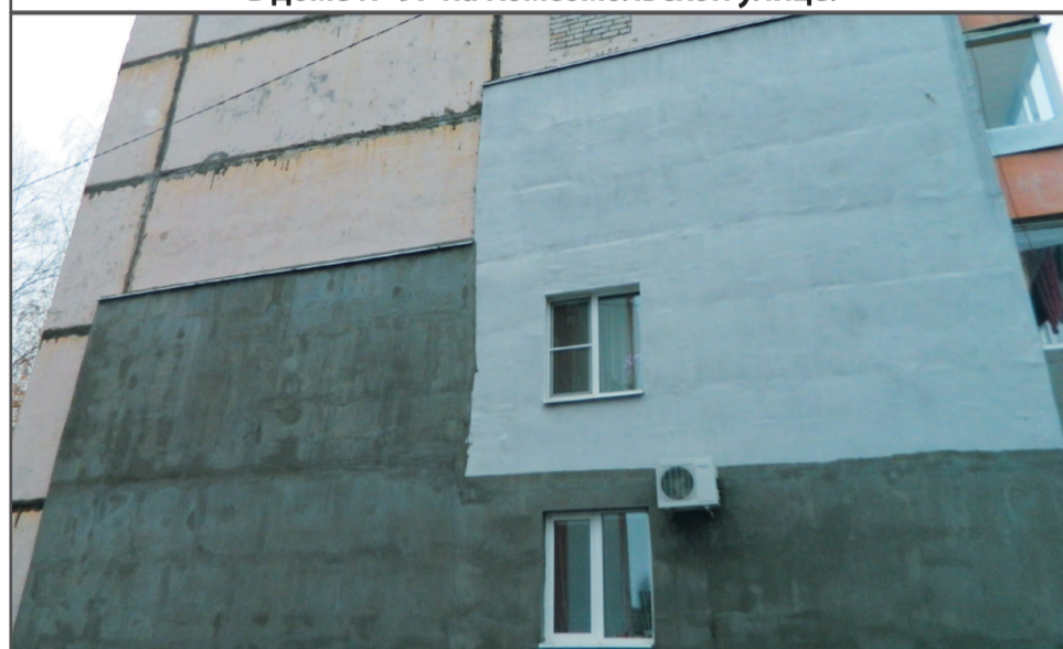
Утепление торцевой стены в доме № 107 на Комсомольской улице.