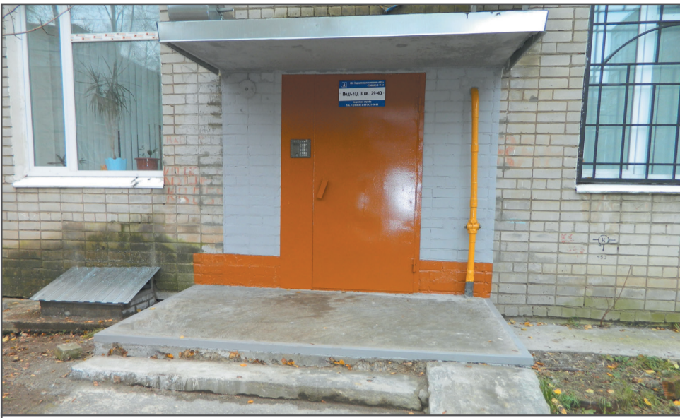
Ремонт козырьков, входных групп с покраской и вентиляционных окон в доме № 76 на Комсомольской улице.