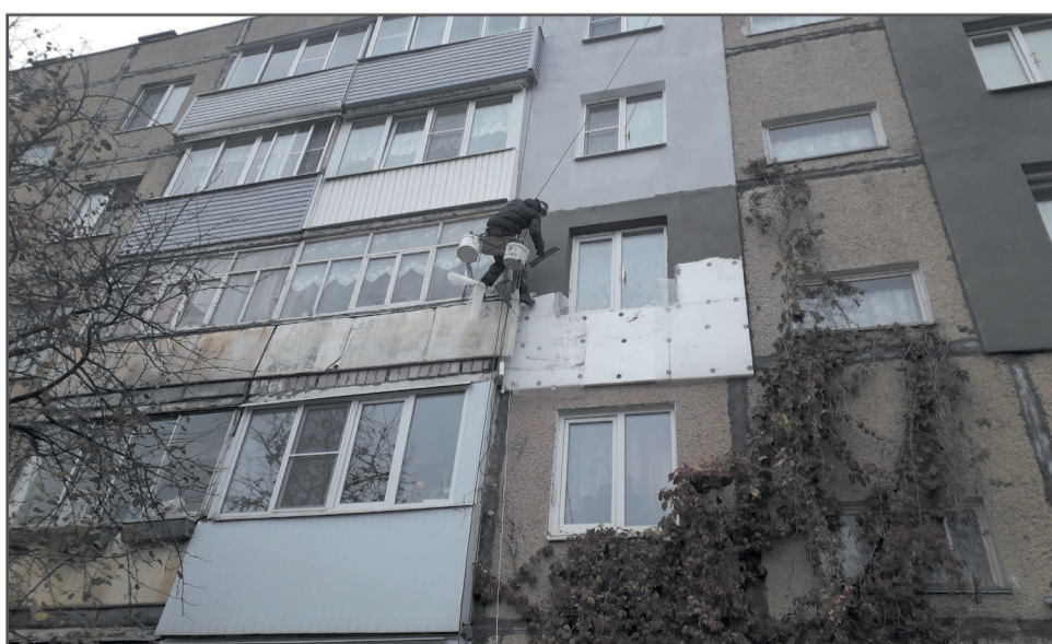
Утепление наружных стен по заявлениям жителей в доме № 89 на Комсомольской улице.