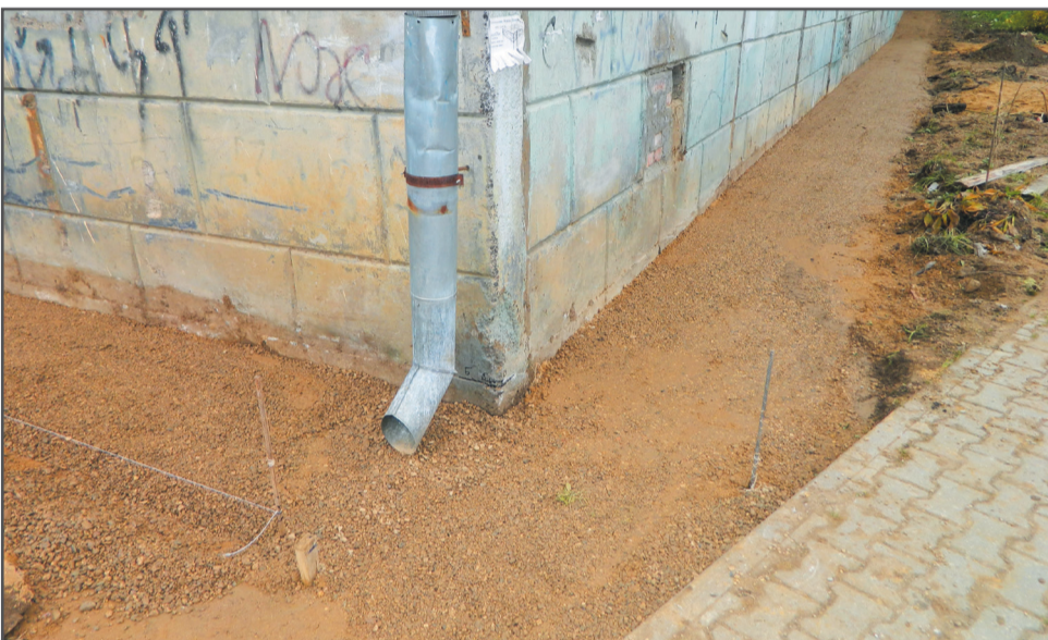
Ремонт отмостки дома № 45 на улице Моторостроителей.