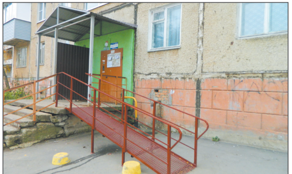
Изготовлен пандус по заявлению жителей дома № 67 на Комсомольской улице