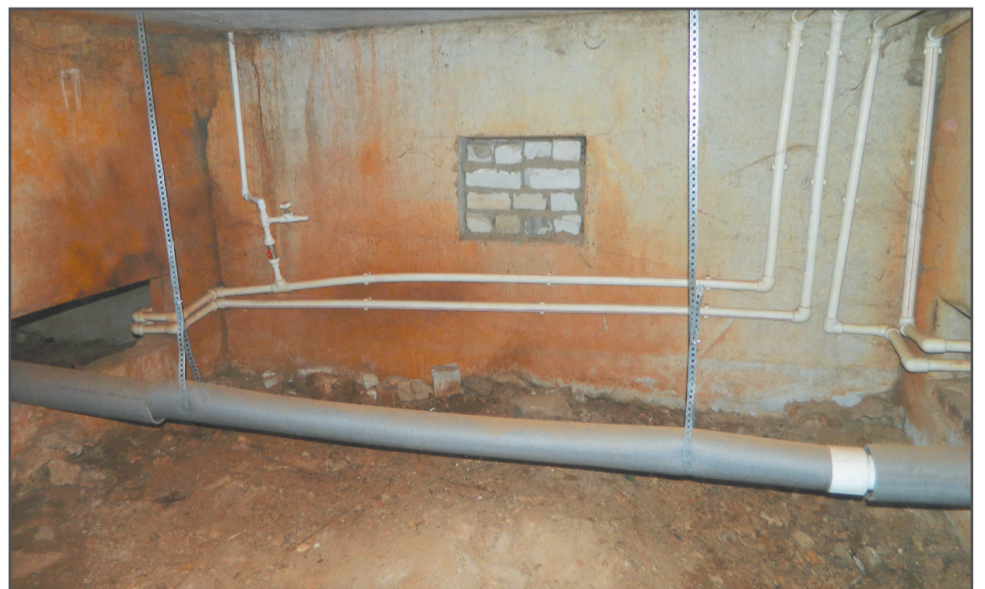
Замена розлива холодного водоснабжения в доме № 107 на Комсомольской улице.