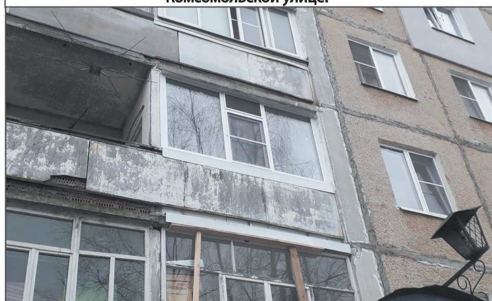
Ремонт балконной плиты. Комсомольская, 69.