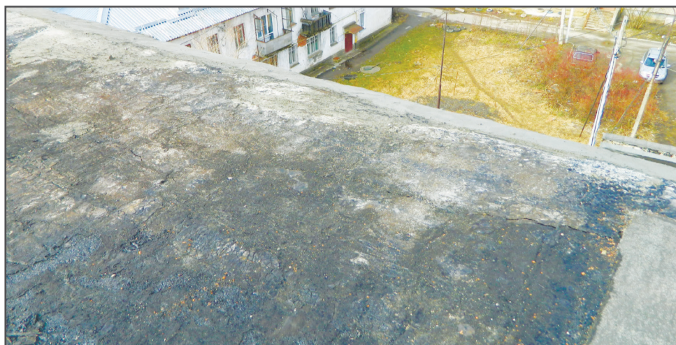
Ул. Пролетарская, д. 7

Собственники многих домов принимают решение об установке камер видеонаблюдения в подъездах. Это делается в целях обеспечения безопасности жителей и как мера воздействия на недобросовестных граждан, портящих общее имущество, для привлечения их к ответственности.