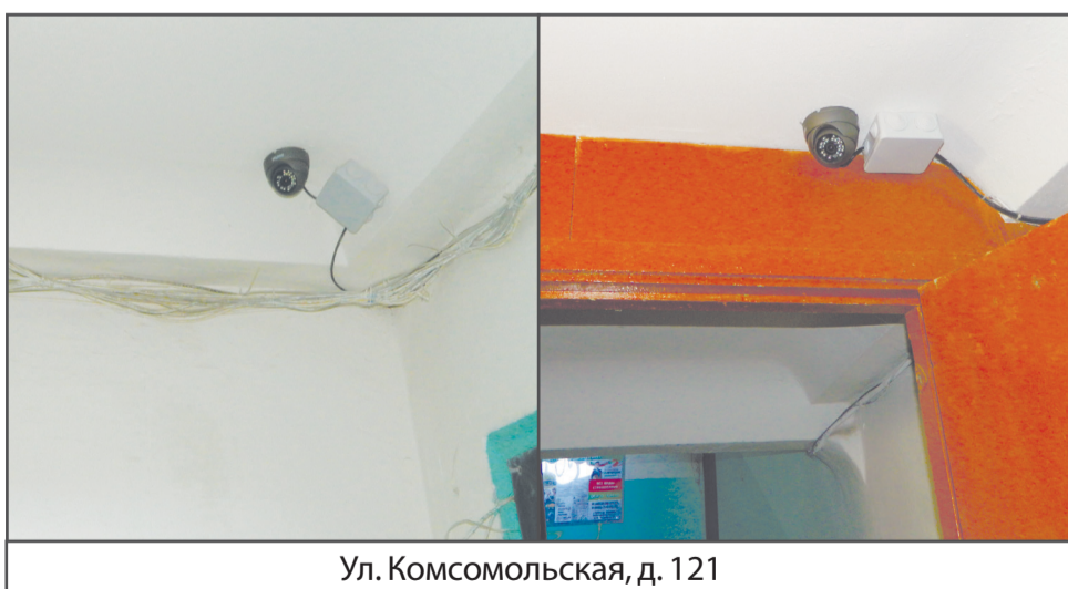
Ул. Комсомольская, д. 121

Произведен косметический ремонт подъездов, провода уложены в специальные короба. Нашими управляющими компаниями ежемесячно обновляется по несколько подъездов в домах, но, к сожалению, не везде жители обеспечивают сохранность ремонта. Благодарим собственников, проживающих по данному адресу, за добросовестное отношение к своему жилью. С прошлого ремонта все подъезды были в удовлетворительном состоянии, как и почтовые ящики, замененные несколько лет назад. Такой хозяйский подход – залог рачительного отношения к собственным средствам.