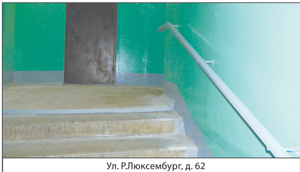
Ул. Р.Люксембург, д. 62

С наступлением благоприятного температурного режима, управляющие компании приступили к ремонту межпанельных швов.