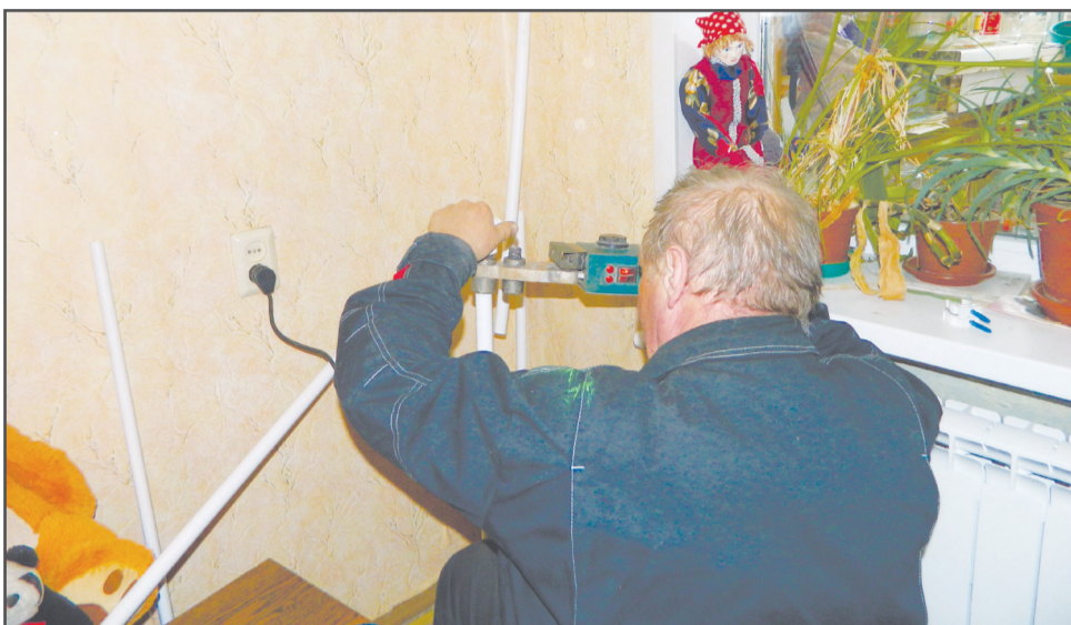
Ул. Моторостроителей, д. 79.

Плановая замена стояков отопления в квартирах. Этой работой управляющие компании заняты постоянно, так как трубы со временем изнашиваются, основная эксплуатационная нагрузка приходится на их внутреннюю часть и циркуляция воды затрудняется, что приводит к проблемам с отоплением. Для того чтобы произвести плановую замену системы, жителям необходимо написать заявление и предоставить доступ во все квартиры по стояку.