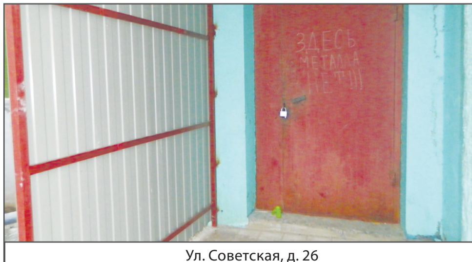
Ул. Советская, д. 26

Для удобства жителей, при необходимости, в подъездах устанавливаются дополнительные поручни. Очень часто об этом просят пожилые люди, которым сложно подниматься по лестнице.