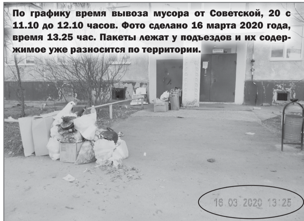
По графику время вывоза мусора от Советской, 20 с 11.10 до 12.10 часов. Фото сделано 16 марта 2020 года, время 13.25 час. Пакеты лежат у подъездов и их содержимое уже разносится по территории.

Телефоны единого диспетчерского контакт-центра ООО «Хартия»: (84852) 233-800, 207-202.