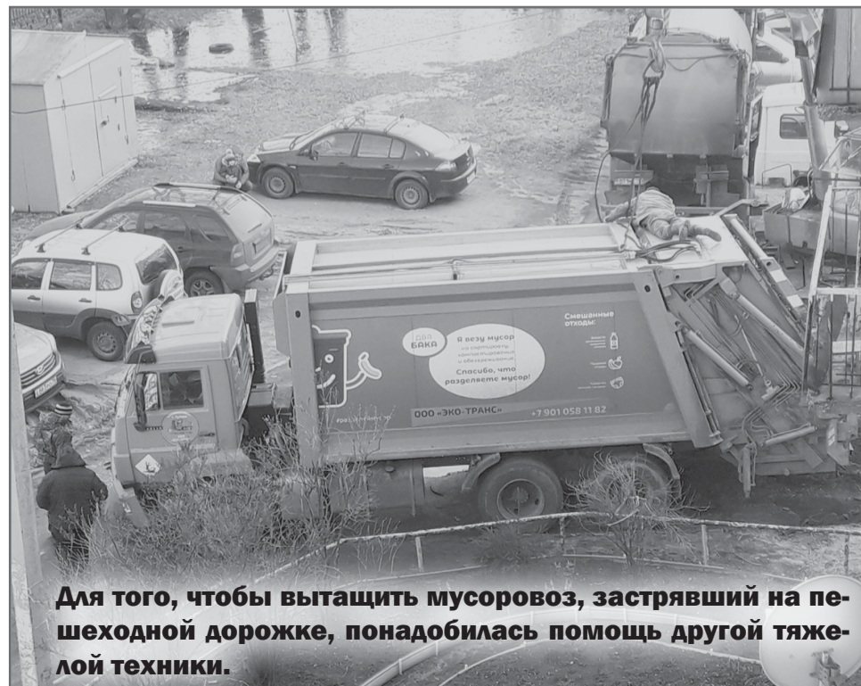
Для того, чтобы вытащить мусоровоз, застрявший на пешеходной дорожке, понадобилась помощь другой тяжелой техники.

тографиями и требованием разобраться в сложившейся ситуации, но, как говорится «ни ответа, ни привета» не