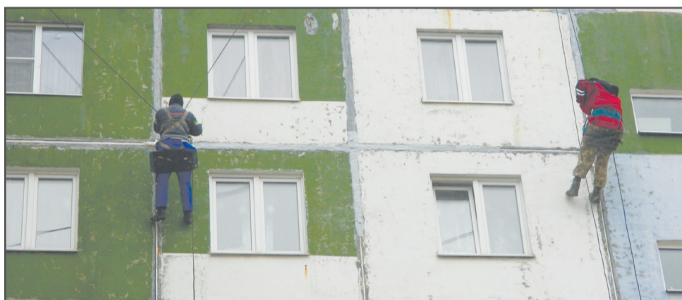
Ул. Советская, д. 26

Сильным ветром сорвало покрытие с участка кровли. Как только позволили температурные условия, управляющая компания приступила к ремонтным работам. Прежде чем уложить новый кровельный материал, была выполнена бетонная стяжка.