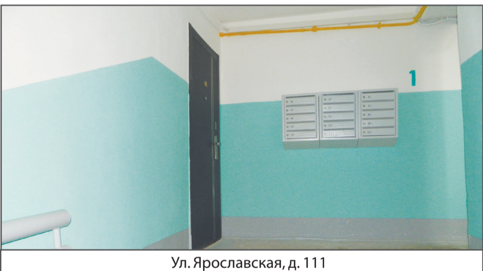
Ул. Ярославская, д. 111

Плановая замена стояков отопления в квартирах. Этой работой управляющие компании заняты постоянно, так как трубы со временем изнашиваются, основная эксплуатационная нагрузка приходится на их внутреннюю часть и циркуляция воды затрудняется, что приводит к проблемам с отоплением. Для того чтобы произвести плановую замену системы, жителям необходимо написать заявление и предоставить доступ во все квартиры по стояку.