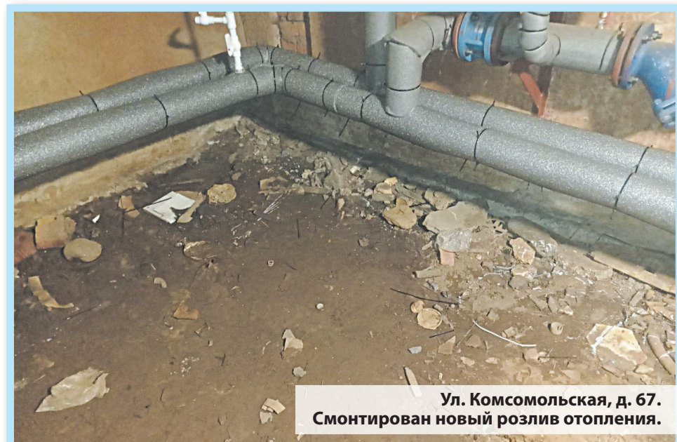
Ул. Комсомольская, д. 67. Смонтирован новый розлив отопления.