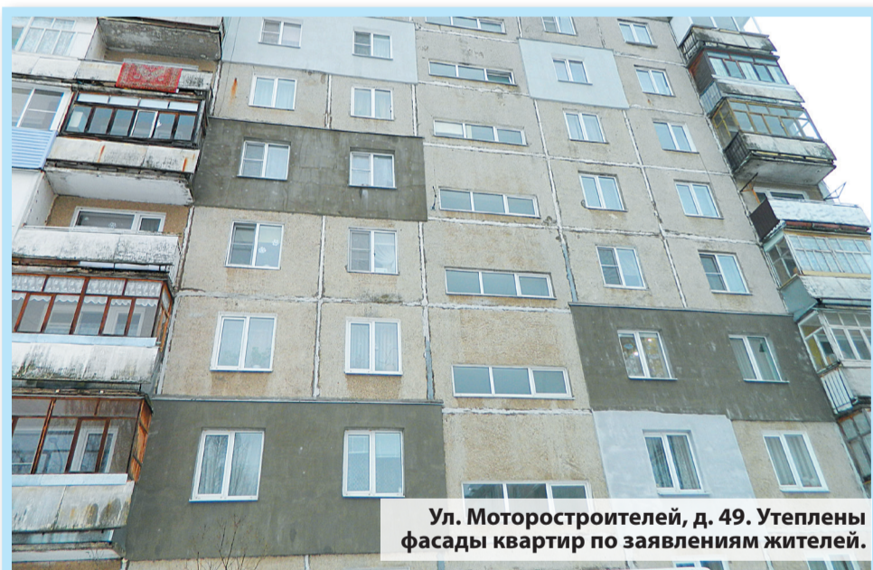
Ул. Моторостроителей, д. 49. Утеплены фасады квартир по заявлениям жителей.