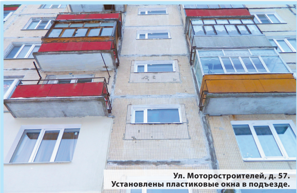
Ул. Моторостроителей, д. 57. Установлены пластиковые окна в подьезде.