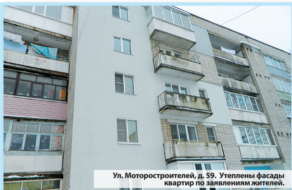
Ул. Моторостроителей, д. 59. Утеплены фасады квартир по заявлениям жителей.