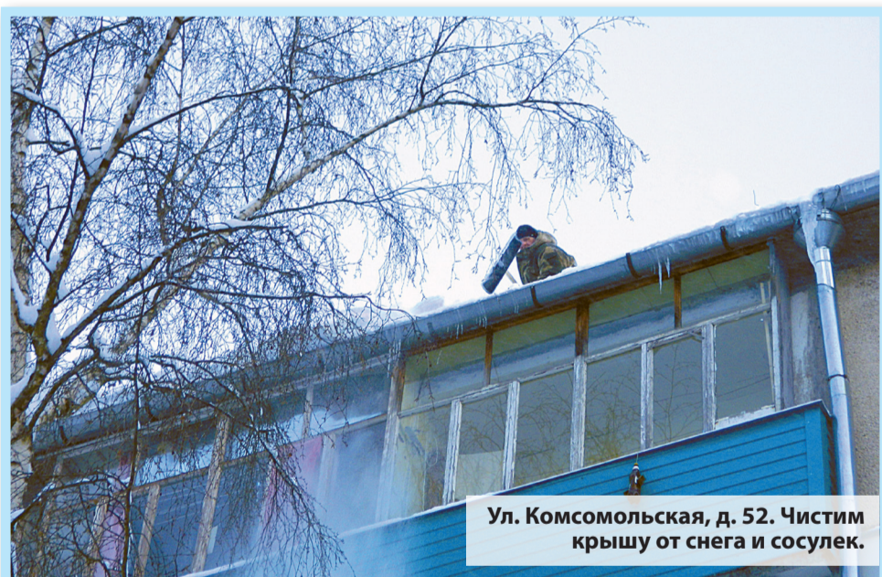
Ул. Комсомольская, д. 52. Чистим крышу от снега и сосулек.