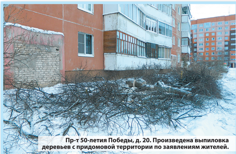
Пр-т 50-летия Победы, д. 20. Произведена выпилка деревьев с придомовой территории по заявлениям жителей.