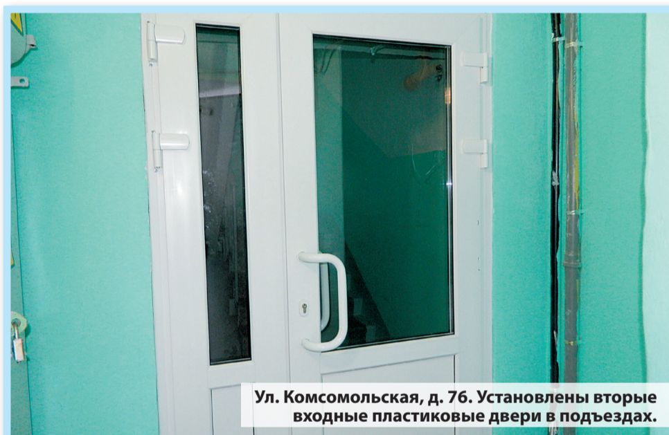
Ул. Комсомольская, д. 76. Установлены вторые входные пластиковые двери в подьездах.