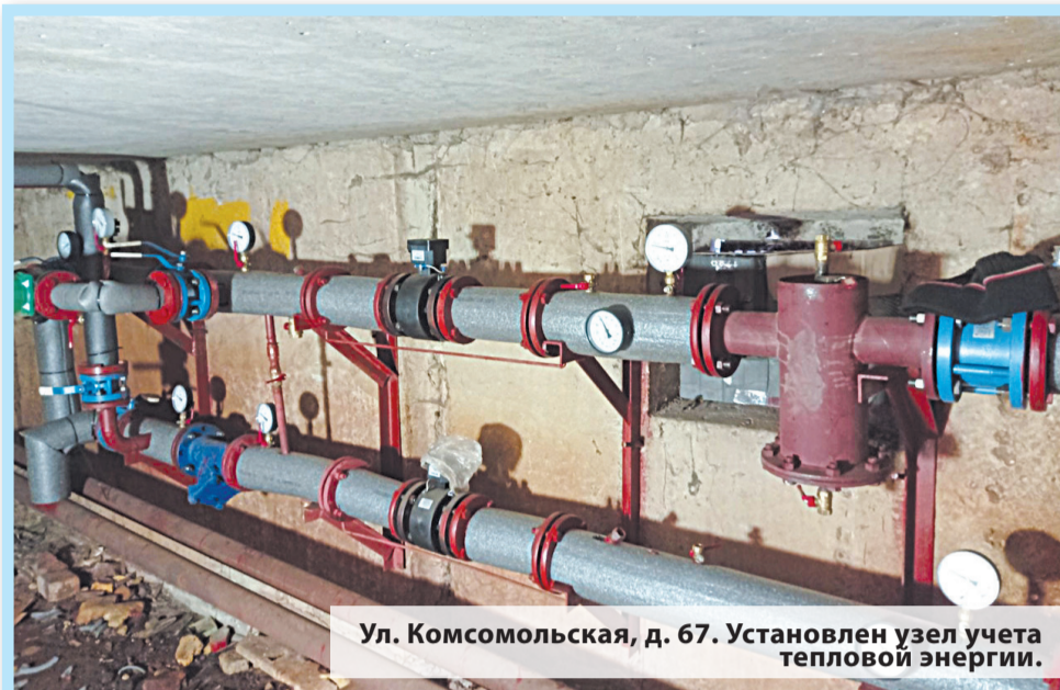
Ул. Комсомольская, д. 67. Установлен узел учета тепловой энергии.