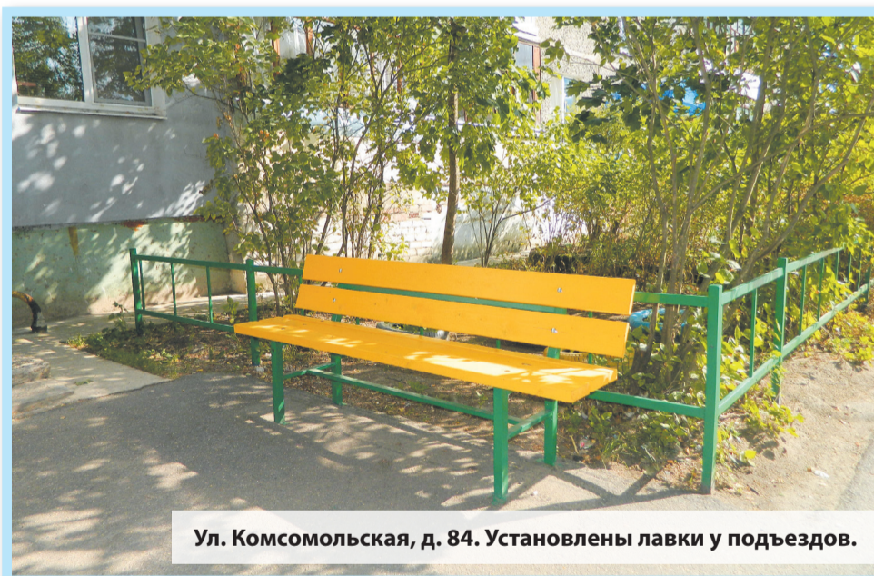
Ул. Комсомольская, д. 84. Установлены лавки у подъездов.