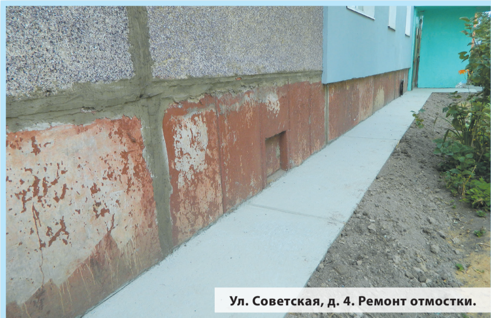
Ул. Советская, д. 4. Ремонт отмостки.