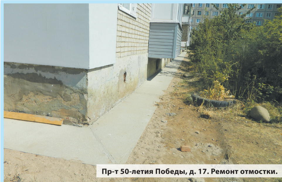
Пр-т 50-летия Победы, д. 17. Ремонт отмостки.