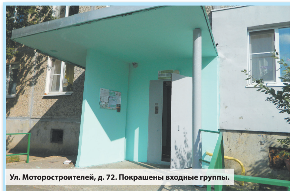
Ул. Моторостроителей, д. 72. Покрашены входные группы.