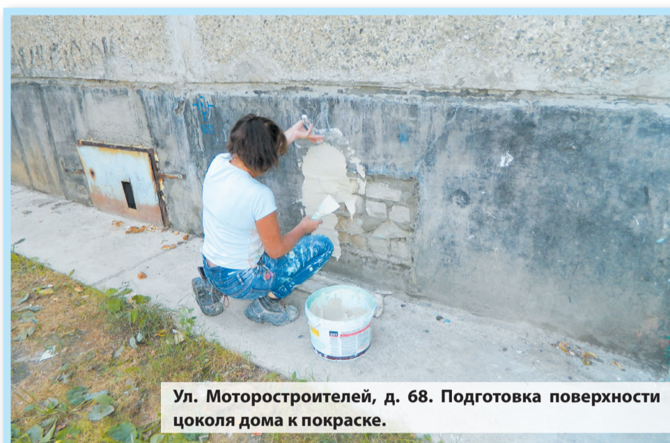
Ул. Моторостроителей, д. 68. Подготовка поверхности цоколя дома к покраске.