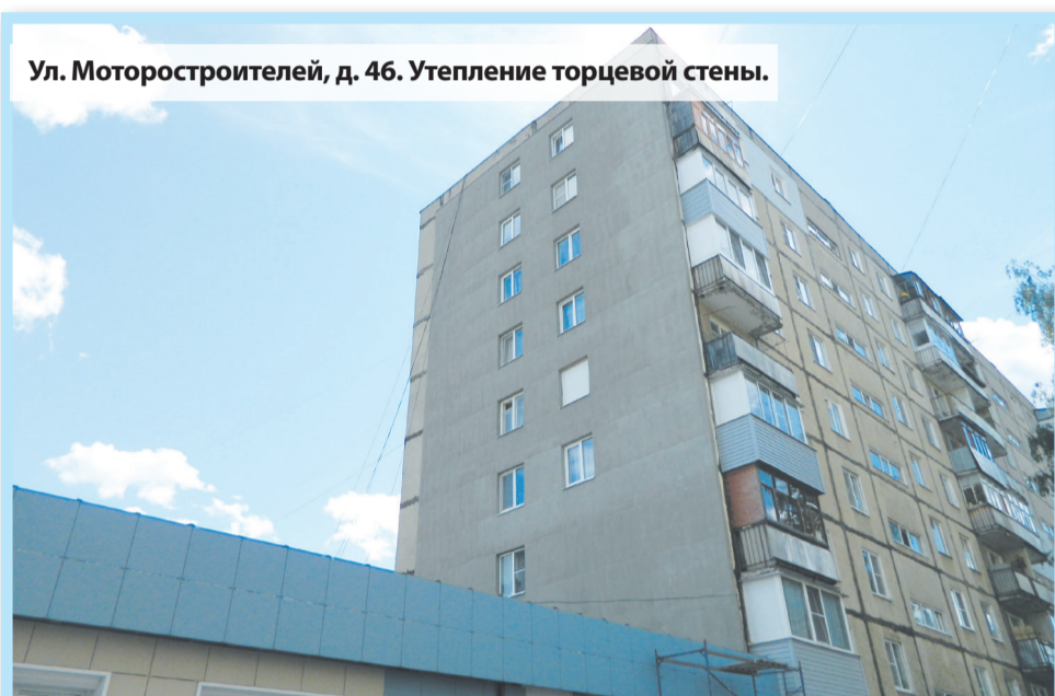
Ул. Моторостроителей, д. 46. Утепление торцевой стены.